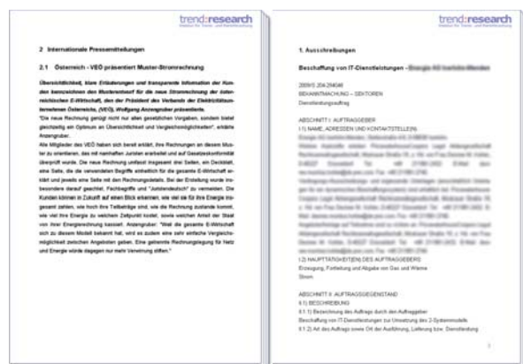
Beispiel für ein Projekt-, Ausschreibungs- und Presse-Clipping

trend:research verfügt mit seinen Studien über ein Markt- und Wettbewerbs-Know-how, das – lt. Aussage verschiedener Marktteilnehmer, Verbände und Berater – einmalig in Deutschland ist. Wesentliche Verbände (z.B. VfwV, BDE) greifen auf das Know-how und die Kompetenz von trend:research zurück, teilweise durch Projekte, Vorträge (z.B. E-World, TÜV-Akademie) und Referate, teilweise durch intensive Partnerschaften.